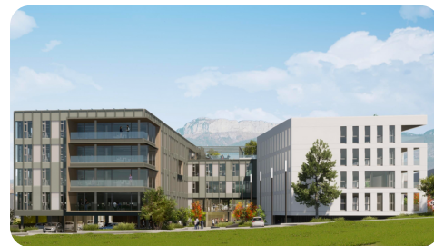
CAD Invest : Construction de bureaux Annecy le Cairn Tranche 1 - 9 250 m 2 - 19 M€HT