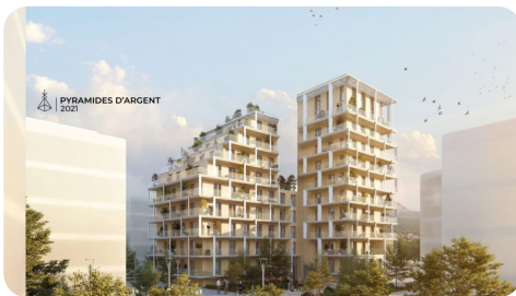
EDIFIM : Construction de logements Opération Ginkgo - 44 logements - 5,6 M€HT ©PETITDIDIERPRIoux Architectes