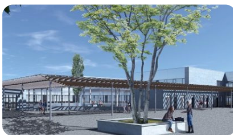
Paillasser Frères : Collège Georges Brassens à Pont Evêque Travaux de restructuration - 9 M€HT © Atelier d'IS