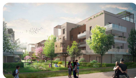
JT Constructions : Ferney Voltaire - Garden Park Construction de 100 logements + hôtel © SUD Architectes