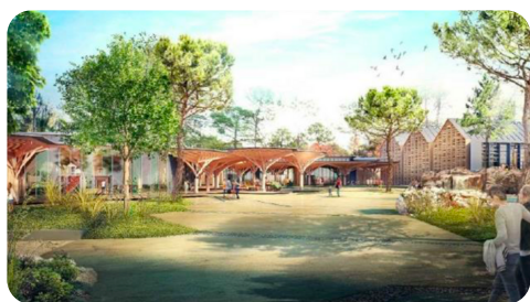
Logistaq : Center Parcs Lot et Garonne Cœur de village et bâtiments annexes - 50 M€HT © art'ur Architectes